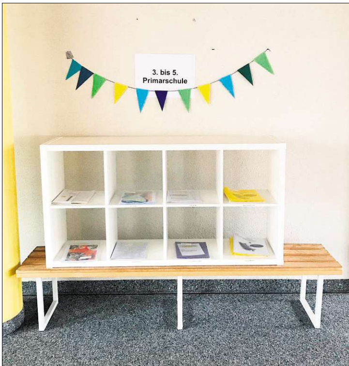
Die Arbeitsblätter für den Postversand sind vorbereitet.